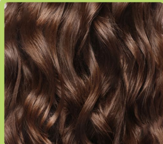
легкие «пляжные» волны