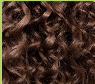
натурально вьющиеся и подвижные локоны